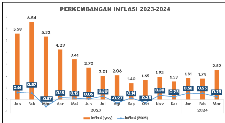
Grafik 1.1 Inflasi mtm (%)